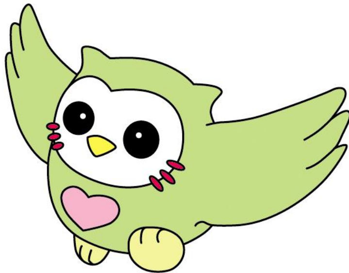
船橋市社会福祉協議会マスコットキャラクター